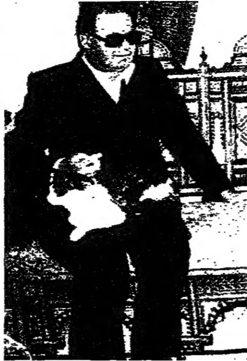
الرئيس الحصن في منزله أمس يدايب هرتة